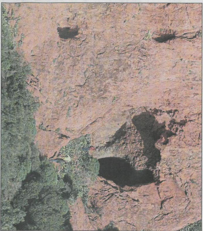
Le massif de l'Estérel a été classé comme monument naturel par décret du Premier ministre le 3 janvier 1996.

Notre démarche est participative, voilà pourquoi nous mobilisons aussi les différents acteurs locaux : agents communaux, associations – dont le Club alpin français de l'Estérel, celui de Cannes Côte d'Azur et l'Estérel club cycliste adréchois –, offices de tourisme, chasseurs, apiculteurs et même le Centre de ressources, d'ex-