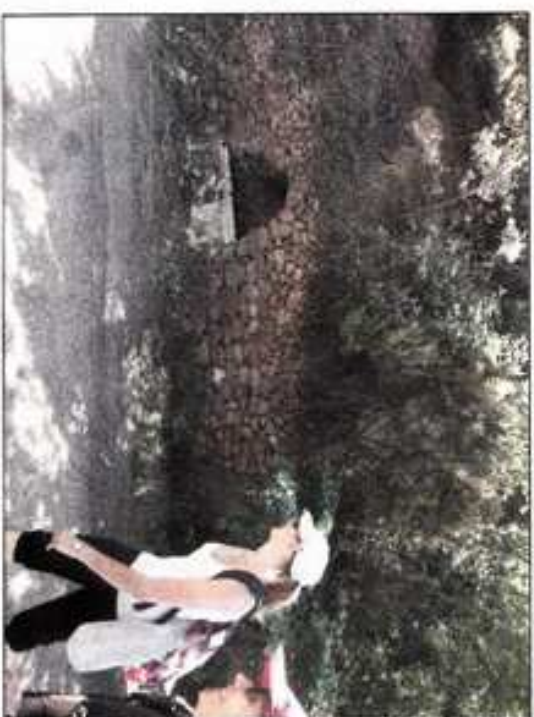
Les bénévoles ont charrié des blocs pour résoudre les problèmes d'érosion des chemins.