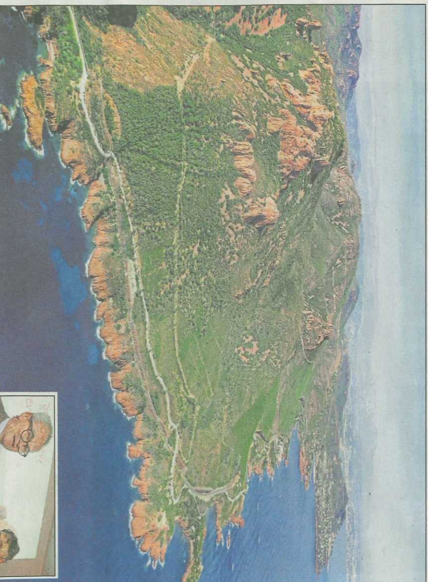
Le massif de l'Estérel officiellement en route pour le label Grand site de France avec l'Opération Grand site, co-pilotée par l'État et le Syndicat de protection du Massif, symbolisés ici par la poignée de main entre le préfet du Var et Nello Broglio.

Il s'agit d'aménager le massif pour le valoriser. Cela devrait, par exemple, se concrétiser par des réalisations comme des installations d'accueil aux principales portes d'entrée du massif, une requalification du stationnement pour intégrer dans le paysage ou encore la mise en place d'une nouvelle