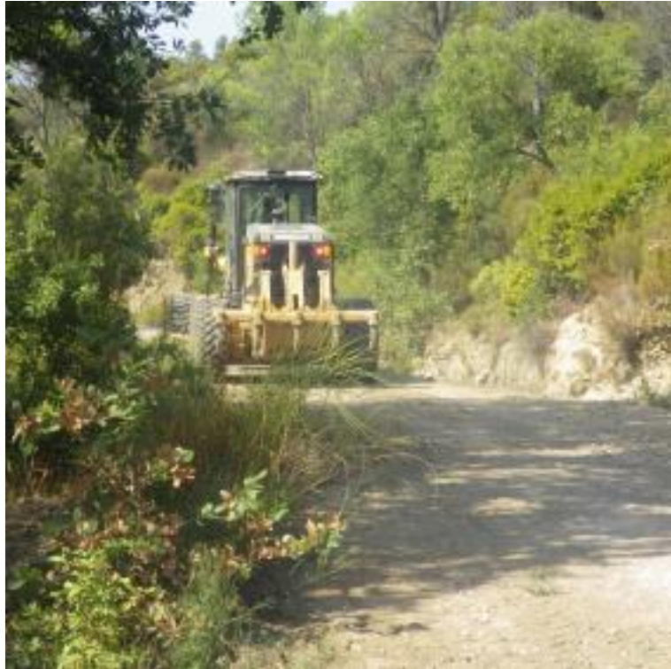
Piste DFCI H76 Auriasque