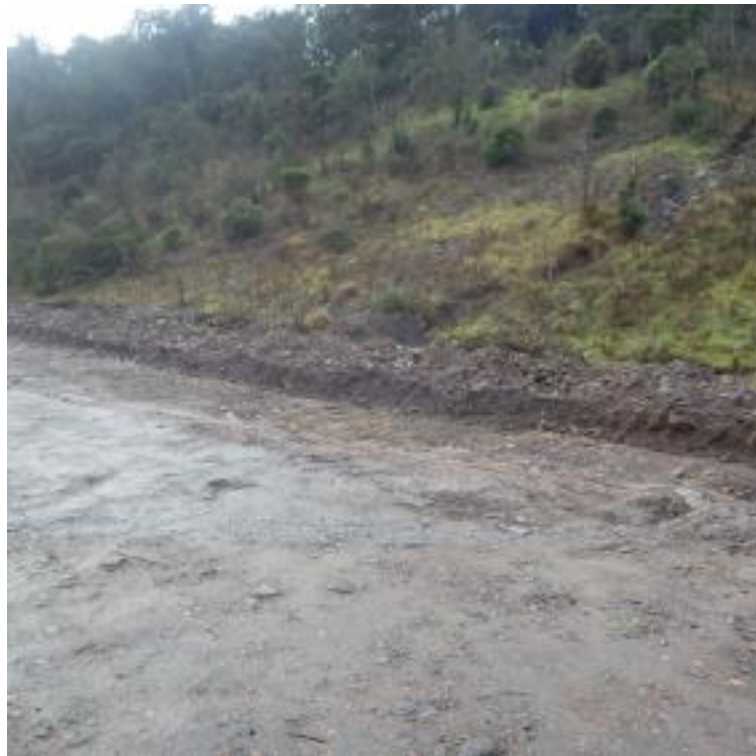
Fossé reprofilé le long du parking du lac de l'Avellan