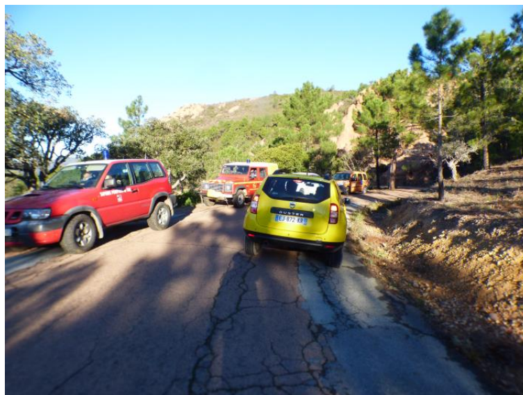
Visite technique du 3 décembre 2021 (voir tableau suivant)

La D.D.T.M, le Département et le SDIS du Var y ont accès, mutualisant ainsi les informations.