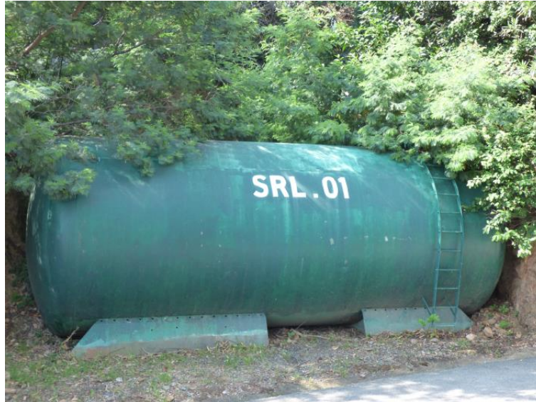
Exemple de citerne à déplacer située actuellement au Trayas

Suite à l'érosion créée lors de la crue d'octobre 2015 dans le vallon du Grenouillet, la commune de Saint-Raphaël a entrepris de consolider l'entrée à la Forêt Domaniale de l'Estérel au niveau de son accès majeur situé à Agay en réalisant un mur de soutènement de la route DFCI H38 de Gratadis.