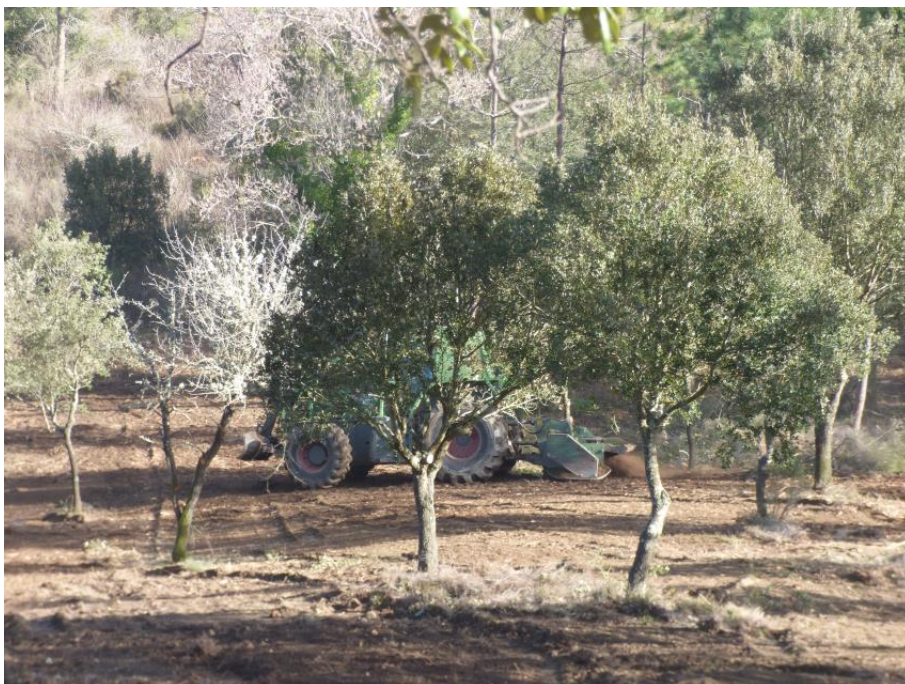
Débroussaillage mécanique de la piste DFCI G31 de Malpasset