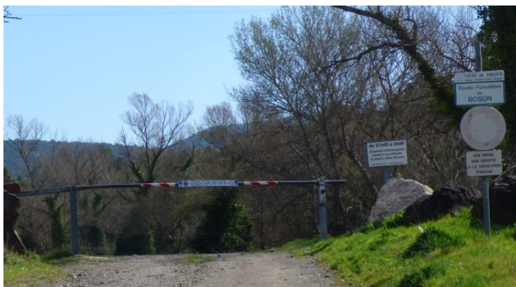
Piste DFCI dont le nom a été rectifié et le mauvais numéro enlevé

Dans l'attente de cette nouvelle numérotation et afin d'éviter aux équipages de sapeurs-pompiers d'être induits en erreur par des indications fausses, il a été réalisé quelques modifications avec les moyens disponibles.