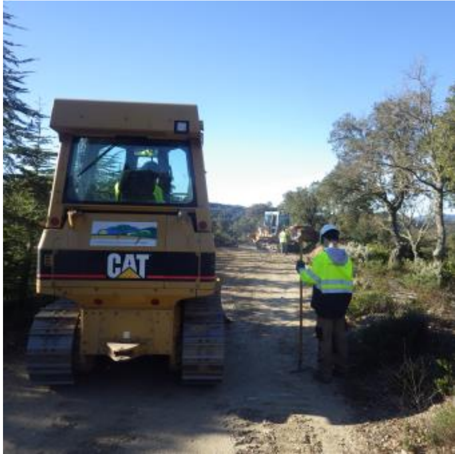
Création d'aires de retournement sur la piste DFCI H82 de l'Apié d'Amic