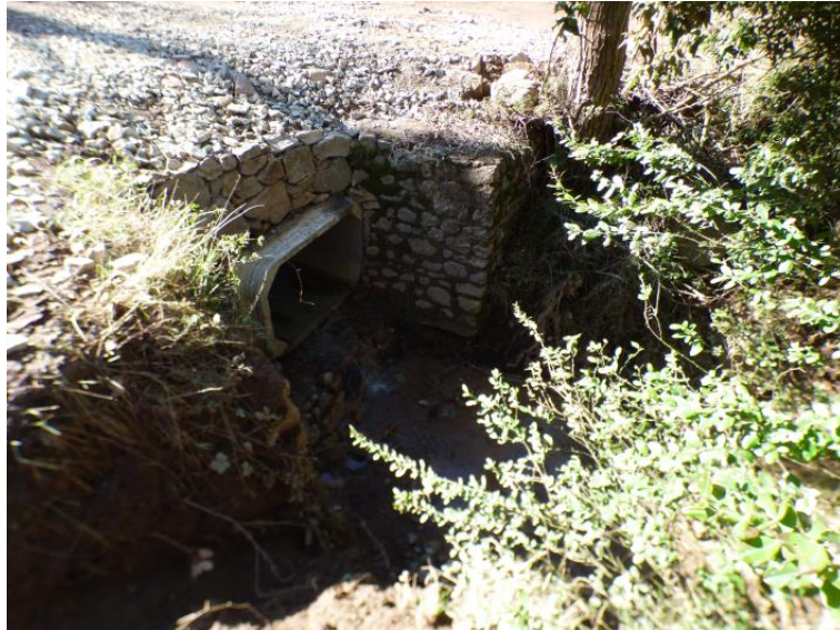
Passage busé sur la piste DFCI H48 de l'Avellan après travaux