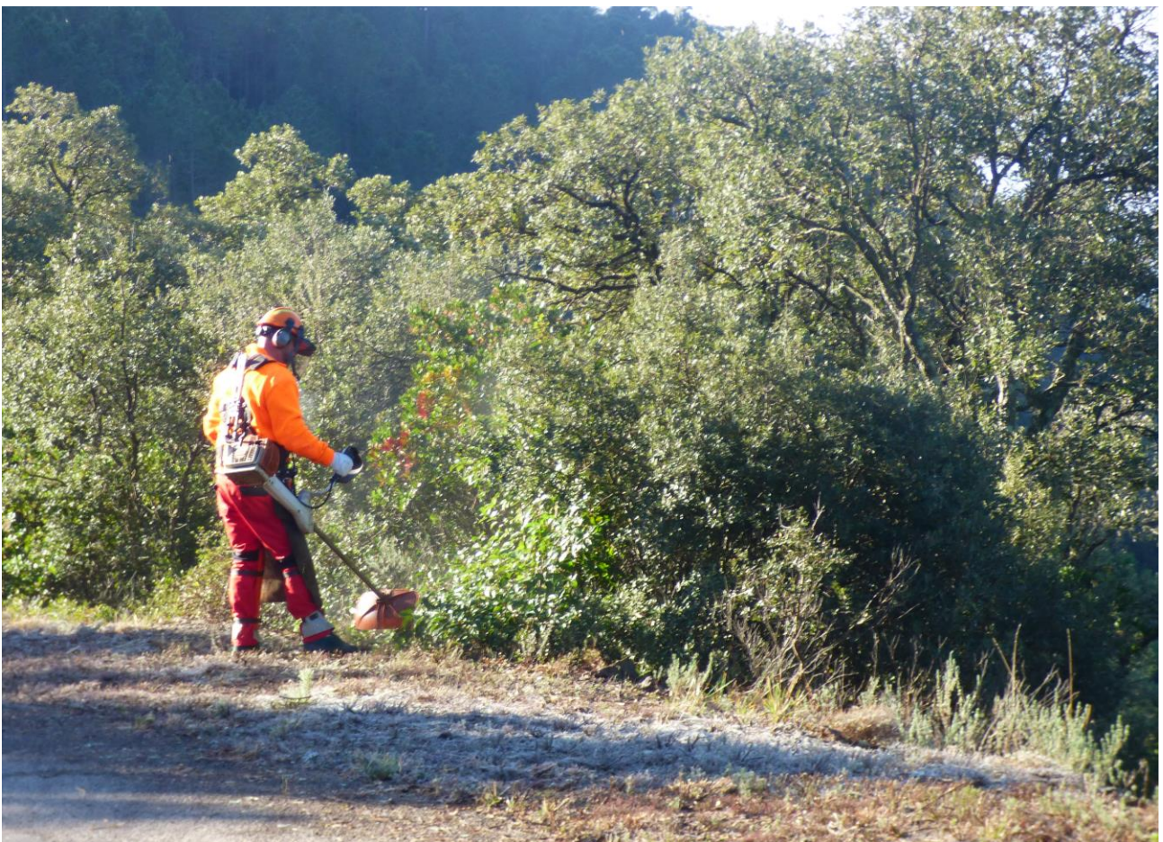
Débroussaillage du glacis de la piste DFCI H72 de la route d'Italie