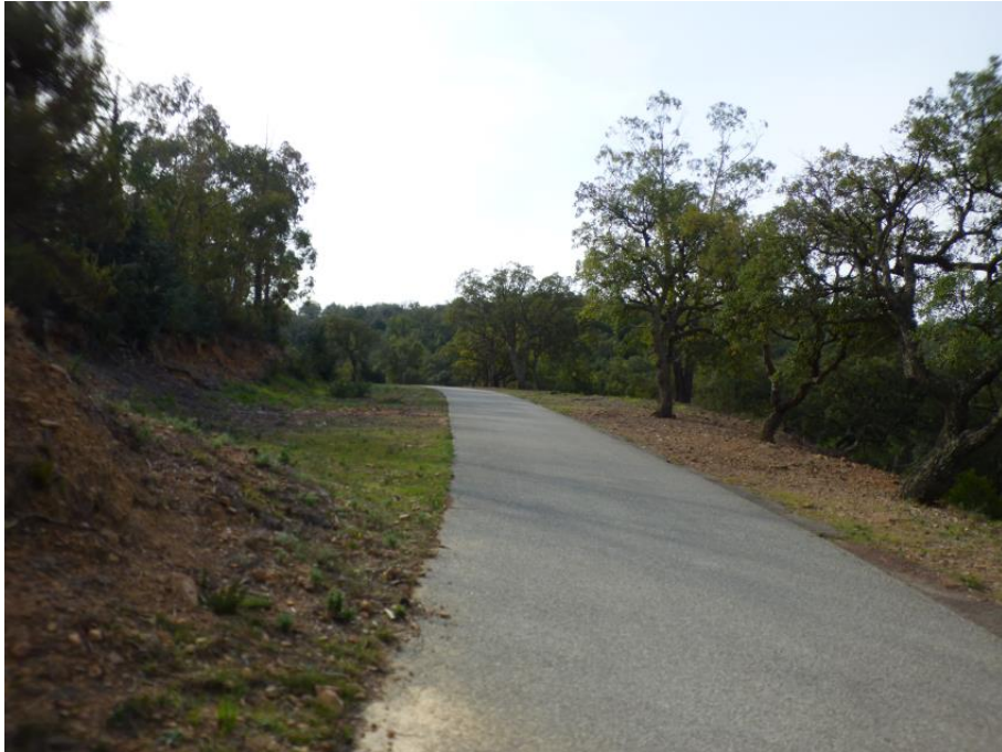
Débroussaillage du glacis d'une aire de croisement sur la piste DFCI H39 Castelli

Chaque année, la commune de Saint-Raphaël demande au Syndicat d'inclure dans le marché public de débroussaillage 4,5 ha de forêt bordant au sud le CVO15 ou route des Golfs, sur une profondeur de 50 mètres.