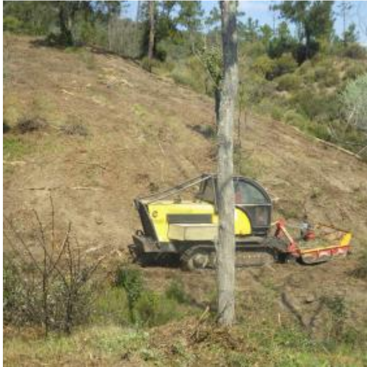
Gyrobroyeur à axe verticale dans la bande de sécurité de la piste DFCI G31 Malpasset