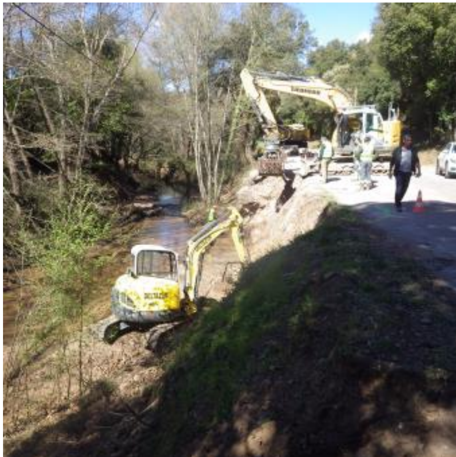
Travaux de soutènement sur route DFCI H 38 de Gratadis - 16 mars 2021

Suite à l'érosion créée lors de la crue d'octobre 2015 dans le vallon du Grenouillet, la commune de Saint-Raphaël a entrepris de consolider l'entrée à la Forêt Domaniale de l'Estérel au niveau de son accès majeur situé à Agay en réalisant un mur de soutènement de la route DFCI H38 de Gratadis.