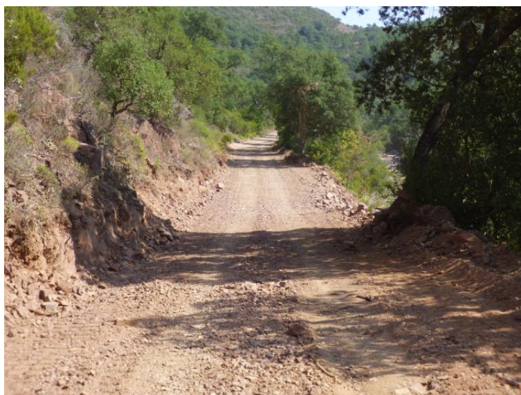
Piste DFCI H23 Les Charretiers réhabilitée grâce au Pôle Génie Civil du Département du Var