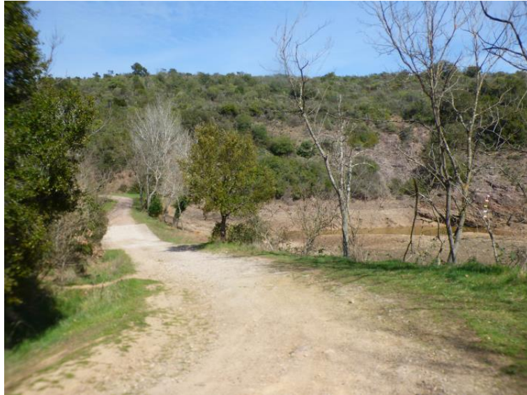
Piste H52 des Espagnols et son passage sur la digue du petit lac de l'Avellan

Cette problématique a entraîné la modification de l'accès au parking du lac et la rédaction d'un Arrêté Municipal du 28 mai 2021. Le Syndicat suit l'évolution de ce dossier. Par ailleurs, la commune a lancé des travaux sur la piste DFCI H48 de l'Avellan. Ces derniers consistent au redimensionnement du passage busé situé avant le parking du lac et à reprofiler un fossé dédié aux eaux pluviales le long ouest du parking du lac afin que celles-ci s'écoulent à l'aval de la digue du Lac de l'Avellan.