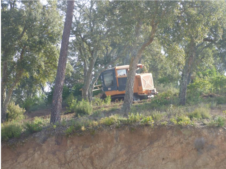
Débroussaillage mécanique de la piste DFCI G31 de Malpasset