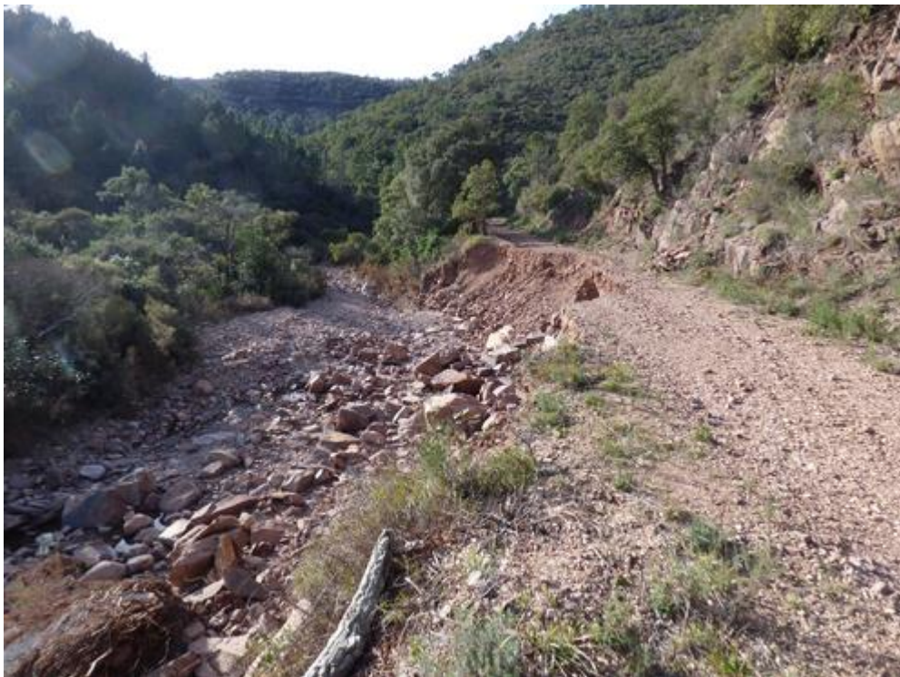
Piste H23 des Charretiers après les violentes pluies du 1 er décembre 2019

La piste DFCI H23 des Charretiers n'était plus praticable.