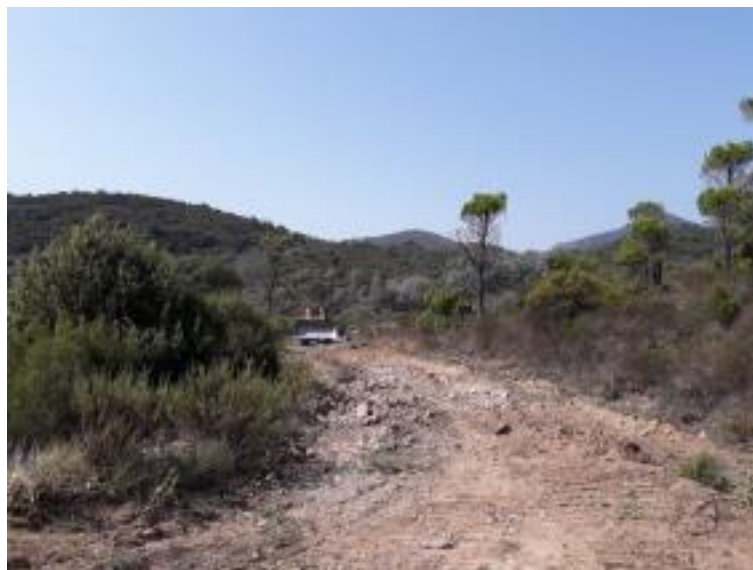
Piste DFCI H23 Les Charretiers