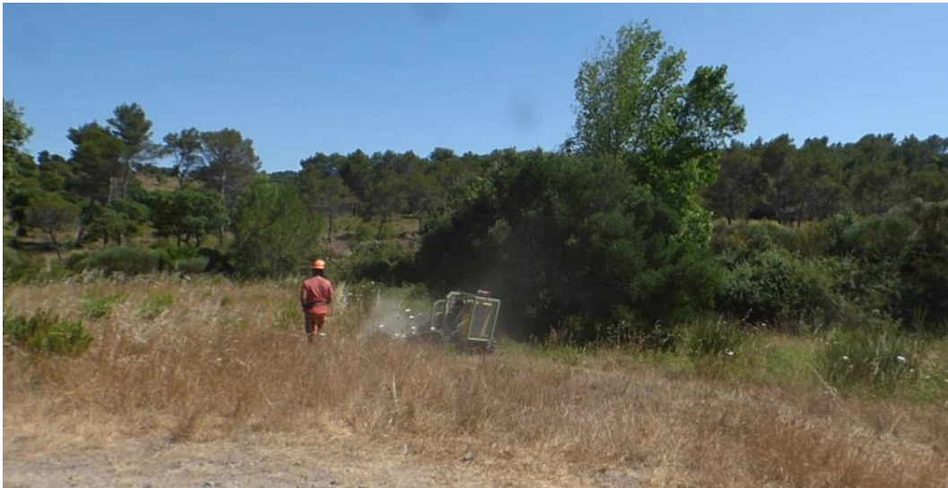
Débroussaillage DFCI au robot télécommandé au sud du CVO15

Chaque année, la commune de Saint-Raphaël demande au Syndicat d'inclure dans le marché public de débroussaillage 4,5 ha de forêt bordant au sud le CVO15 ou route des Golfs, sur une profondeur de 50 mètres.