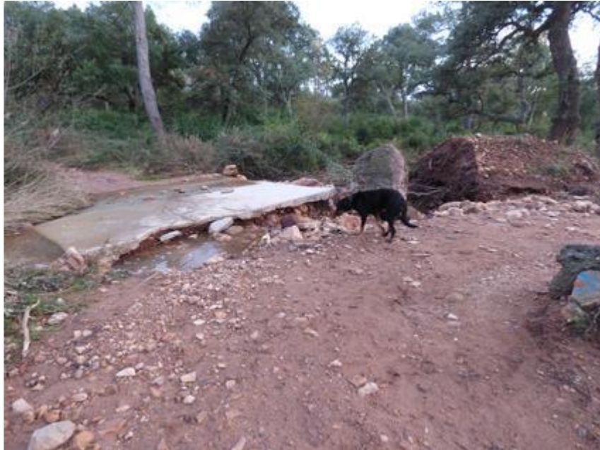
Piste des Lauriers G57 : destruction du radier du ravin des Lauriers en attente de financement au titre du programme FEADER 2022

La piste DFCI H23 des Charretiers n'était plus praticable.