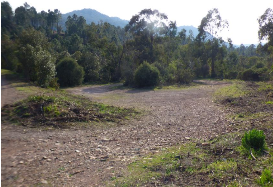
Débroussaillage du glacis d'une aire de retournement sur la route DFCI H31 du Pic de l'Ours