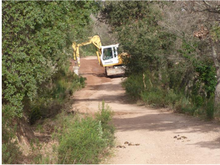
Reprofilage du fossé amont de la piste DFCI G13 du Petit Roc