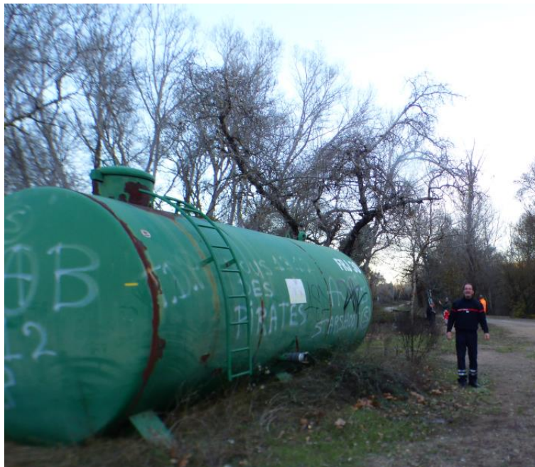
Visite terrain pour les citernes - 3 décembre 2021

Une relation suivie avec le responsable départemental des citernes et poteaux incendie du SDIS a été mise en place. Progressivement, un bilan des citernes DFCI par commune est établi selon le protocole du SDIS et une actualisation des mises aux normes du réseau de ces hydrants est effectuée. (Annexe 6 : fiche de d'évaluation d'une citerne DFCI)