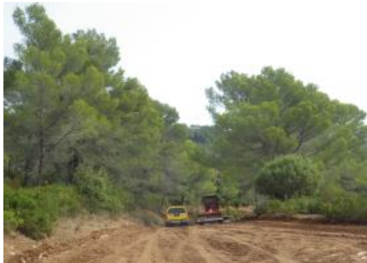
Piste DFCI G 76 la Lieutenante