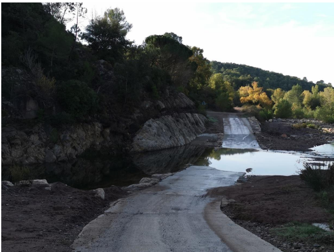
Remise en circulation

Les IF 18,19 et 20, reportés, seront réalisés en 2022 avec le programme de 2021.