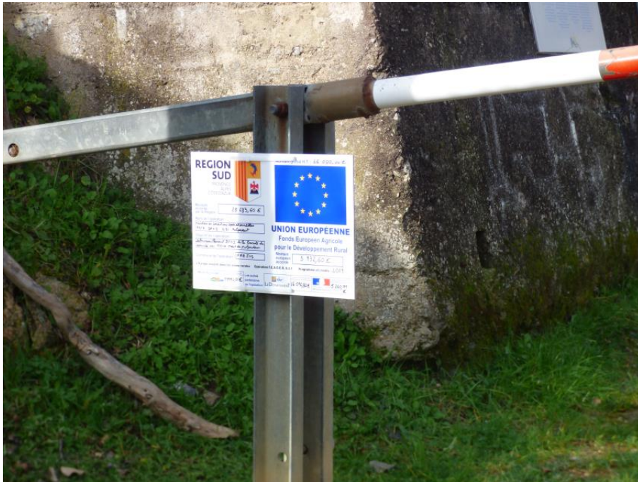
Entrée de la piste DFCI G31 de Malpasset

Les travaux de débroussaillage ont été effectués avant la saison estivale. Le Syndicat a réalisé « à l'entreprise » 63,1 ha de débroussaillage pour un montant de 129.385,00 € H.T. dans le cadre du programme financé. (Annexe 11 : exemple de réalisation des travaux)