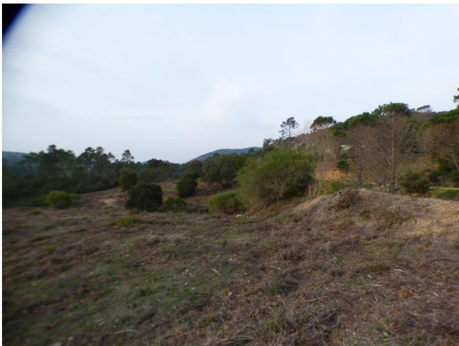
Débroussaillage de la piste DFCI 86 Armélie