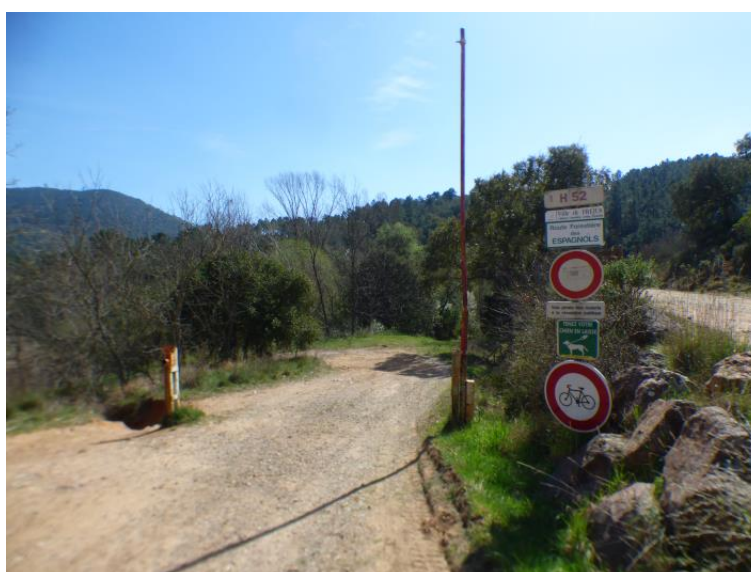
Piste H52 des Espagnols