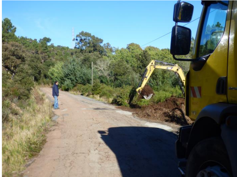
Reprofilage du fossé amont de la piste DFCI H90 route de la Louve