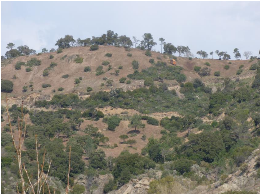
Débroussaillage mécanique de la piste DFCI G31 de Malpasset