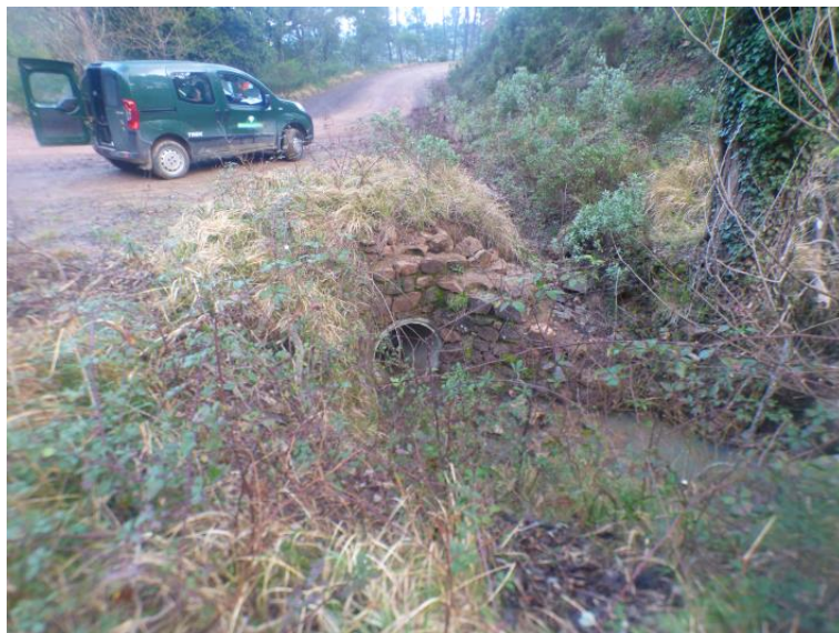
Passage busé sur la piste DFCI H48 de l'Avellan avant travaux

Cette problématique a entraîné la modification de l'accès au parking du lac et la rédaction d'un Arrêté Municipal du 28 mai 2021. Le Syndicat suit l'évolution de ce dossier. Par ailleurs, la commune a lancé des travaux sur la piste DFCI H48 de l'Avellan. Ces derniers consistent au redimensionnement du passage busé situé avant le parking du lac et à reprofiler un fossé dédié aux eaux pluviales le long ouest du parking du lac afin que celles-ci s'écoulent à l'aval de la digue du Lac de l'Avellan.