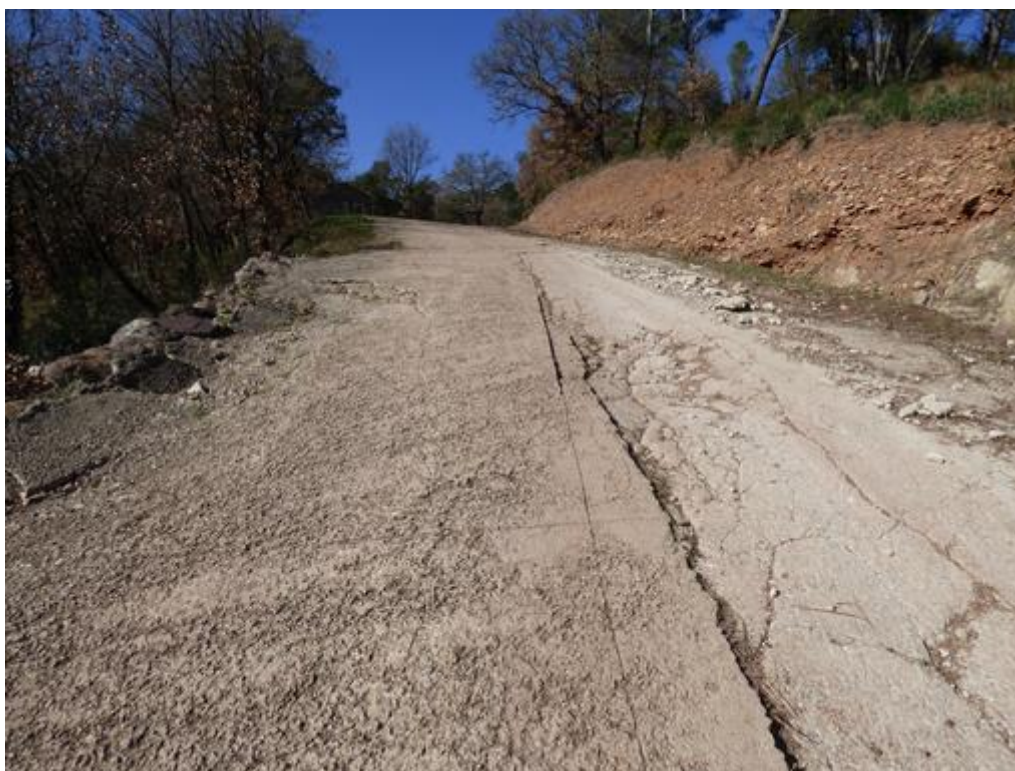
Rampe béton de la piste DFCI G28 de Rossignole

A sa demande, le Syndicat s'est engagé, en 2020, à solliciter des financements afin de créer une servitude de passage D.F.C.I. concernant cette piste. En 2021, une subvention a été obtenue auprès du Département du Var et de la Région Sud Provence-Alpes-Côte d'Azur. Quant au marché public de travaux, il sera lancé en 2022.