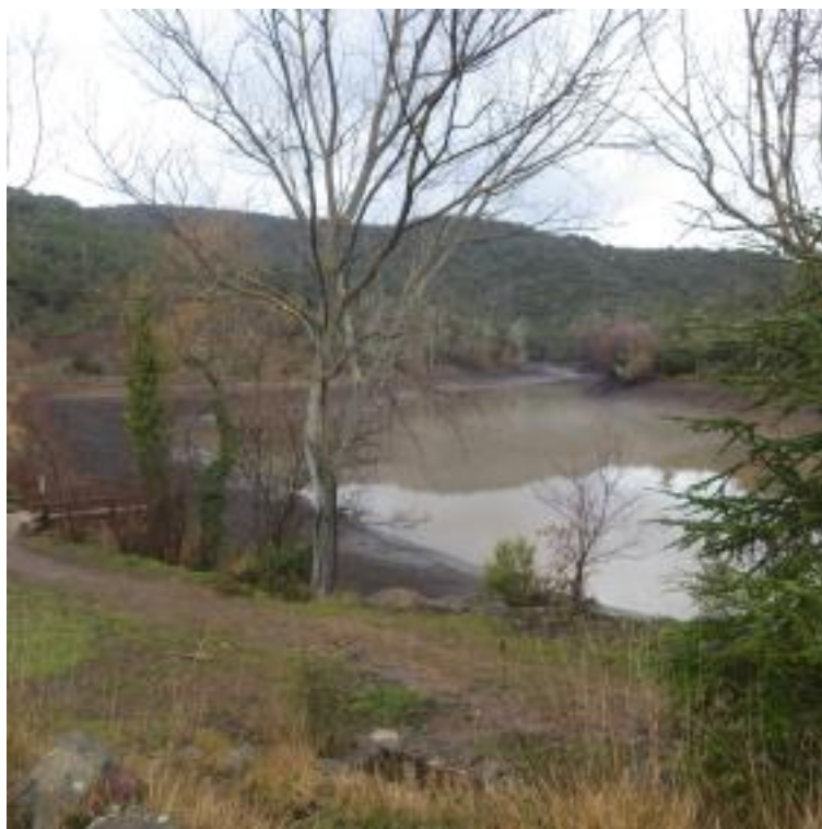
Lac de l'Avellan au niveau d'eau baissé

Dans le même cas de figure, le Petit Lac de l'Avellan, situé en amont sud, voit sa digue remise en cause par des études de sécurité. Sur cette digue se trouve le linéaire de la piste DFCI H52 des Espagnols. La commune aurait besoin de supprimer le barrage mais deux raisons s'y opposent :