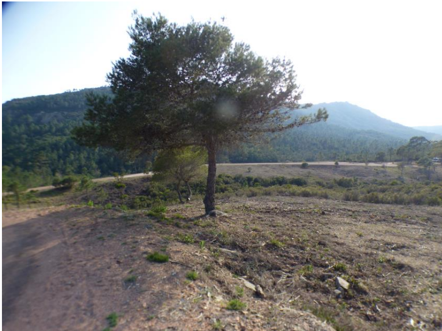
Débroussaillage de la piste DFCI H34 du Plateau d'Anthéor