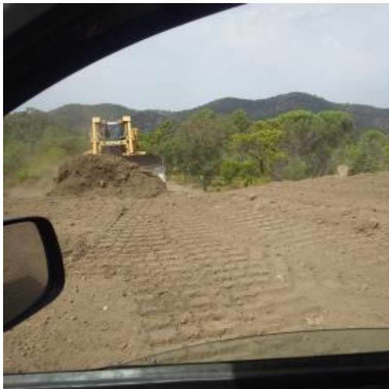
Piste DFCI H78 Boson