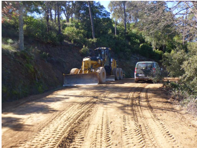
Piste DFCI G31 de Malpasset