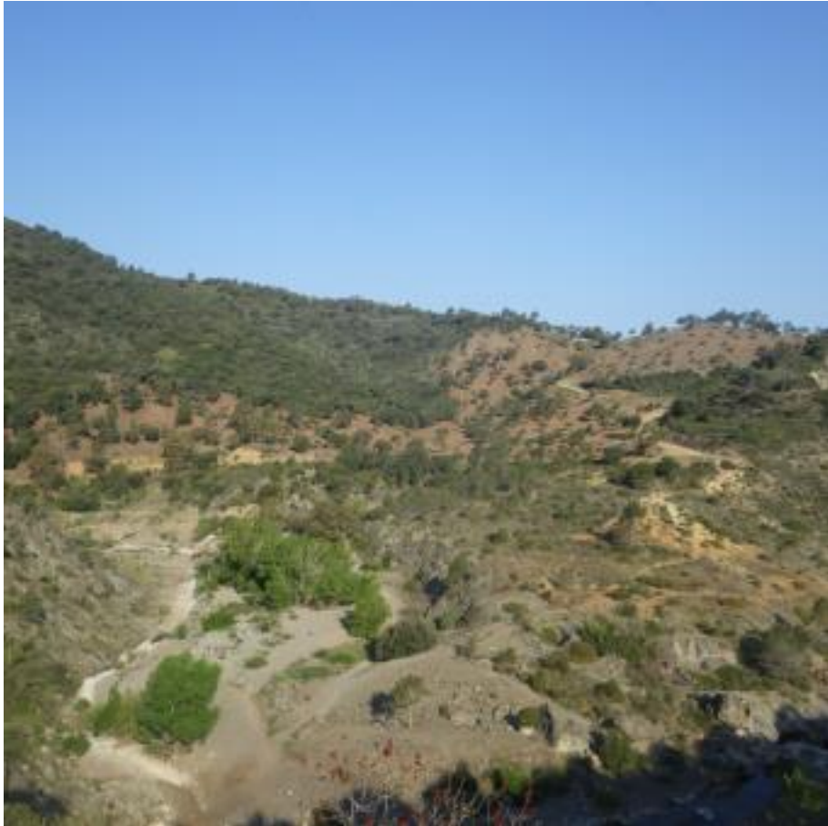
Vue d'ensemble du débroussaillage de la piste DFCI G31 de Malpasset