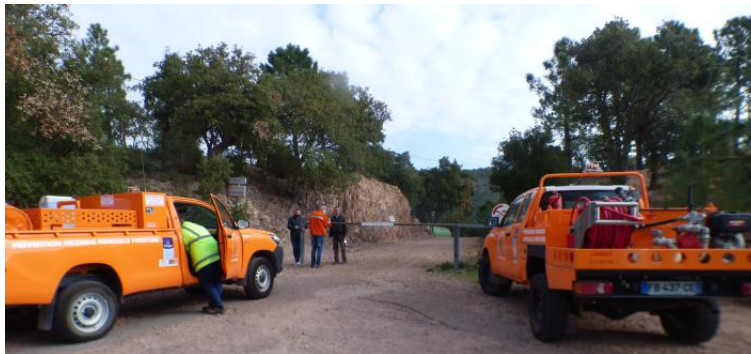
Visite de terrain - Anomalie barrières – 9 mars 2021 Collaboration avec les CCFF de Fréjus

En raison de la pandémie, la concertation et les informations échangées avec les différents CCFF des communes adhérentes au Syndicat se sont réalisées par voies téléphonique ou informatique.