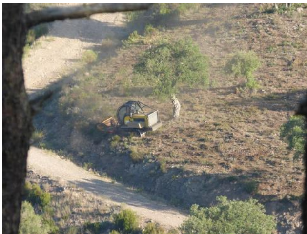
APFM : gyro broyage de la végétation sur piste DFCI G 21 de Magail à Bagnols-en-Forêt

Les A.P.F.M. (Auxiliaires de Protection de la Forêt Méditerranéenne) ont réalisé l'entretien de débroussailllements sur les communes des Adrets de l'Estérel (H 83 partie et H 86 partie), Bagnols-en-Forêt (G 21) et Fréjus (H 68 et H 78). L'ensemble de ces débroussailllements représente une surface réalisée de 58.7 ha pour un montant de travaux estimé à 69 540 € HT. Il convient d'y rajouter le débroussailllement des citernes (16 unités pour un montant estimé à 45 000 € HT).