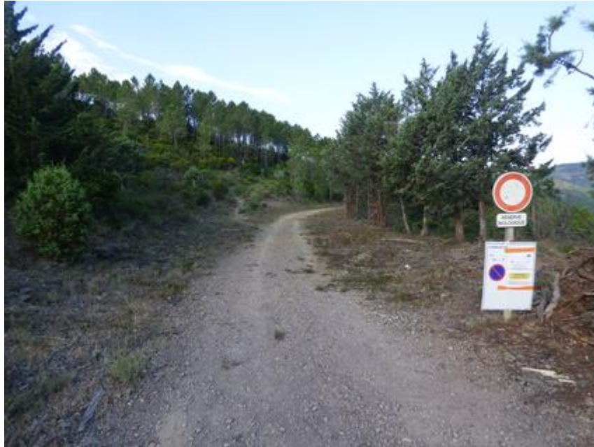
Piste DFCI H 23 des Charretiers avant débroussaillage du glacis