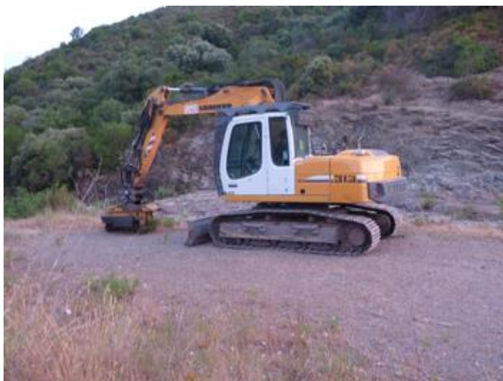
Piste DFCI H 81 de Mare Trache : utilisation d'un gyro broyeur à axe horizontal sur chenilles