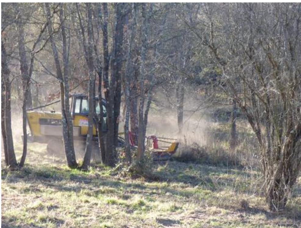
APFM : gyro broyage de la bande de sécurité sur piste DFCI H 86 de l'Armélie à Fréjus