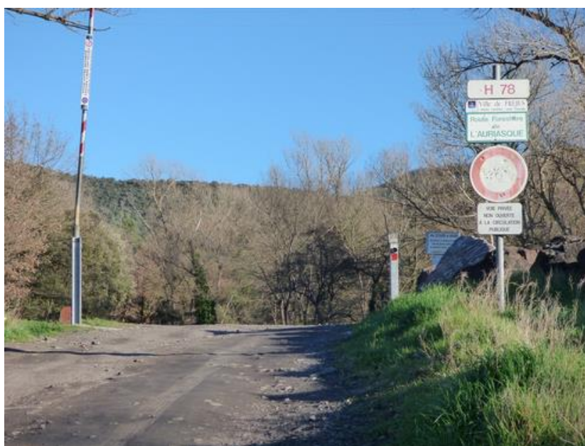
Exemple de piste DFCI dont le numéro ne correspond pas au nom de la piste inscrite sur le PIDAF

Une nouvelle numérotation des pistes DFCI est en attente et devrait être mise en place dans le courant de 2020. En effet, la DDTM a souhaité une modification en profondeur de la numérotation de toutes les pistes DFCI. Pour ce faire, elle proposera une ou plusieurs réunions de travail pour établir cette nouvelle numérotation. Dans l'attente du lancement de cette opération, nous ne pouvons adapter la numérotation au nouveau PIDAF.