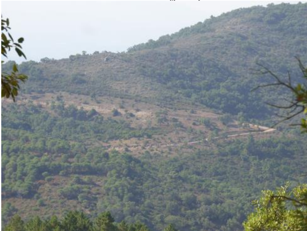
Piste DFCI H 81 de Mare Trache : visuel paysager pris de la RDN 7