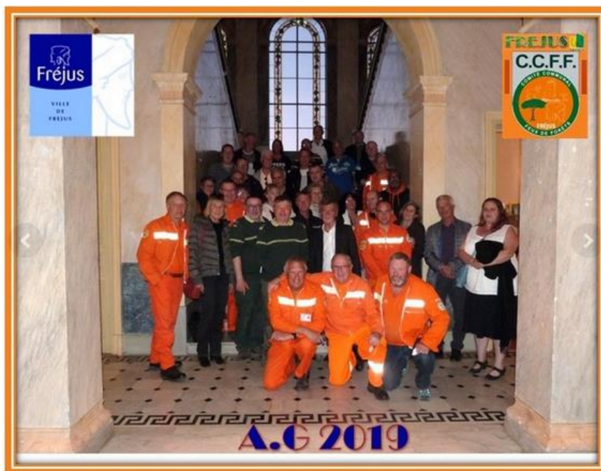
Participation à l'Assemblée Générale des CCFF de Fréjus