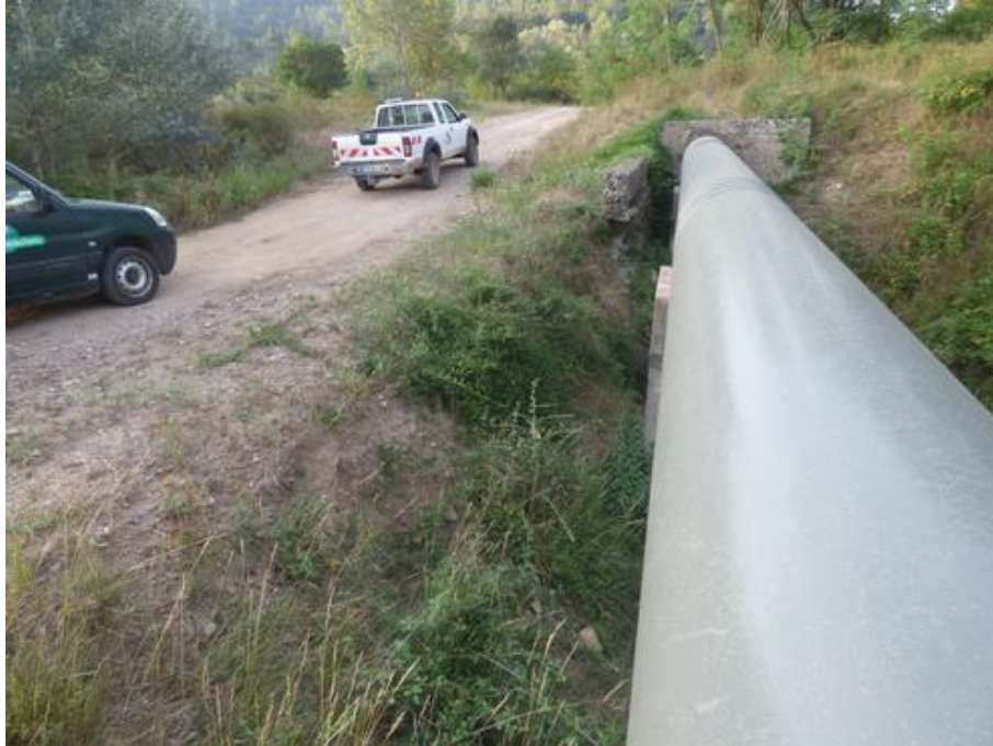
Société du Canal de Provence : rencontre de terrain le 20 août 2019

Société du Canal de Provence (S.C.P.) : Le 20 août 2019, le responsable local de la Société du Canal de Provence a souhaité une rencontre sur le terrain pour évoquer différents sujets liés à la canalisation, qui longe la piste DFCI G 31 de Malpasset. Nous avons échangé nos informations, cela a permis de créer une ambiance d'entente propice à un avenir d'écoute réciproque.