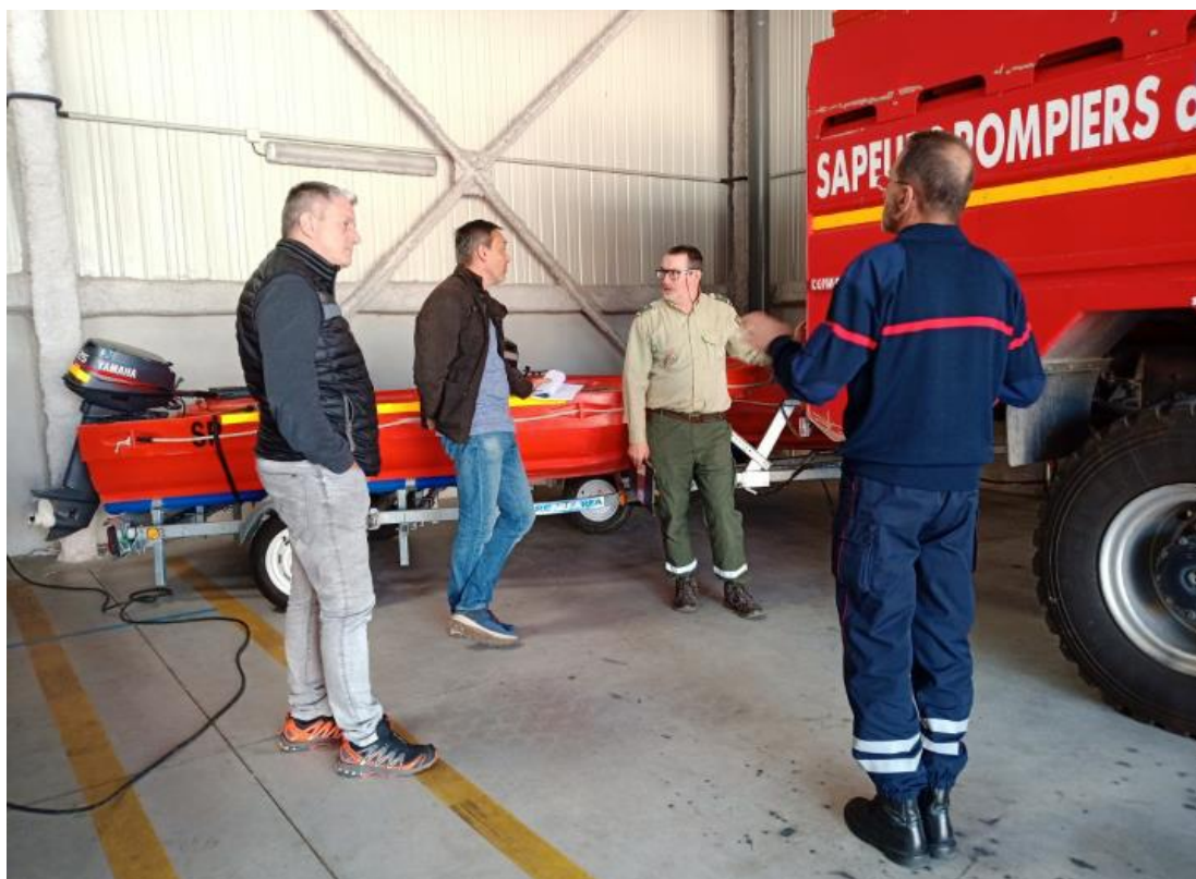
Rencontre avec le Responsable Départemental du SDIS des citernes pour explications des contraintes liées à l'aspiration

particulier, de leur mise aux normes (Cf. : fiche d'évaluation PENA de DFCI et fiche d'évaluation PI – annexes 15 et 16 ).