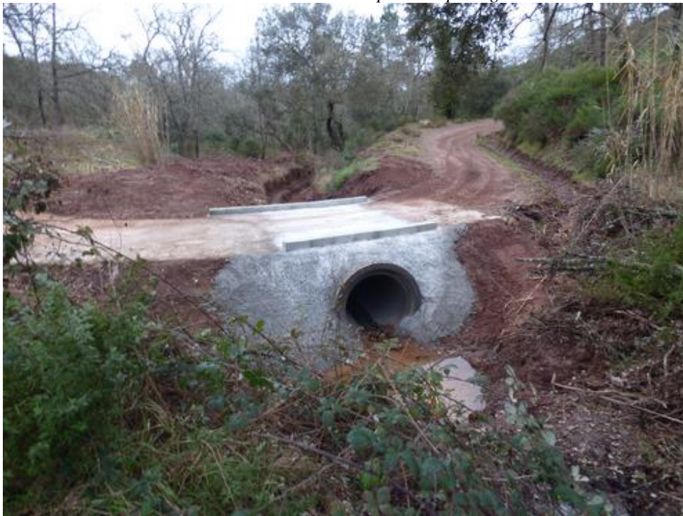
Piste DFCI G 19 de la Culasse : mise en place du passage busé de 1200.

Les IF18 seront réalisés en 2020 avec le programme de 2019.