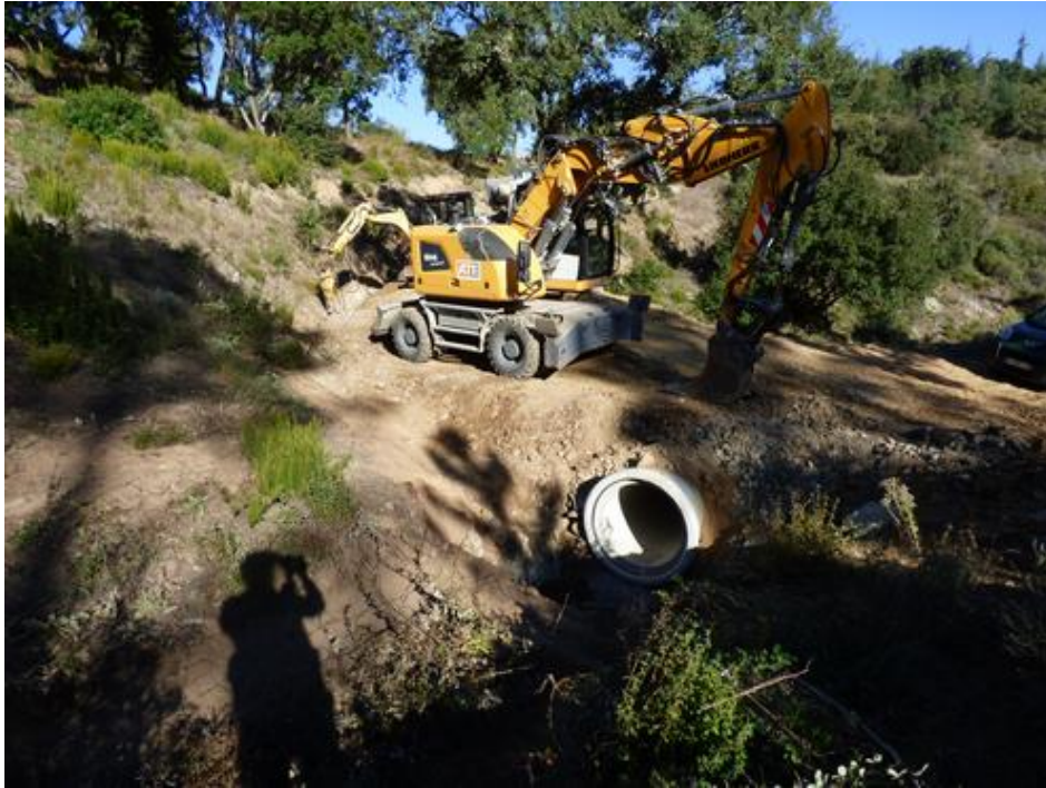
Piste DFCI G 52 des Escolles : mise en place du passage busé de 1000.