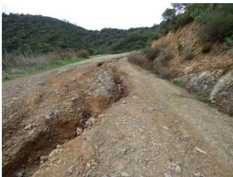
Piste DFCI G 31 de Malpasset

. Les désordres plus conséquents ont fait l'objet d'une demande d'aide au titre du programme Feader 8.3.1 de 2020.