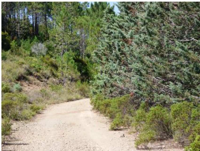
Piste DFCI H 23 des Charretiers avant débroussaillage du glacis

Seul le glacis de la piste DFCI H 23 des Charretiers a été débroussaillée en 2018.