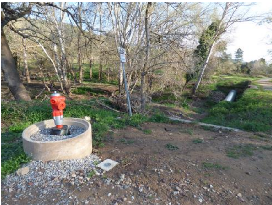
Piste DFCI G 31 :Poteau Incendie aux normes au pont de la Buème

Il nous a informé que le 14 octobre de cette année le Poteau Incendie situé sur la piste DFCI G 31 de Malpasset, à côté du pont de la Buème serait changé pour être mis aux normes.