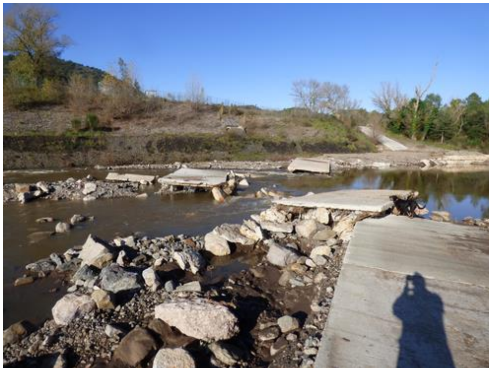
Gué du Reyran après les violentes pluies du 1 er décembre 2019

Dès le 2 décembre 2019, nous avons réalisé le recensement de tous les ouvrages, une nouvelle fois. Cette visite a montré que de nouvelles dégradations mineures étaient intervenues, mais qu'une destruction majeure a définitivement mis hors d'usage le gué du Reyran, qui dessert les 2 plus importantes pistes DFCI du PIDAF Estérel (G 31 de Malpasset au nord de l'autoroute A 8 et H 86 Armélie au sud de l'autoroute A 8).