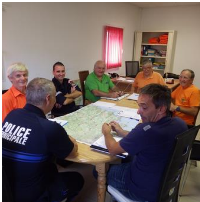
Réunion avec les CCF de Saint Raphaël le 18 septembre 2019

Les C.C.F.F. des communes d'actions du S.I.P.M.E. nous informent des éventuelles anomalies constatées sur le terrain avant la saison afin de permettre la mise en place au plus vite d'actions, pour remettre en état les pistes ou pouvoir informer les pompiers le cas échéant.