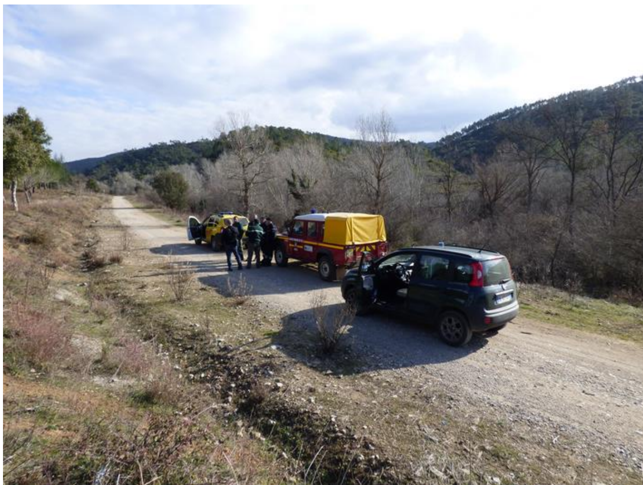
Réunion sur le terrain avec les partenaires institutionnel

La D.D.T.M, le Département et le SDIS y ont accès, mutualisant ainsi leurs informations.