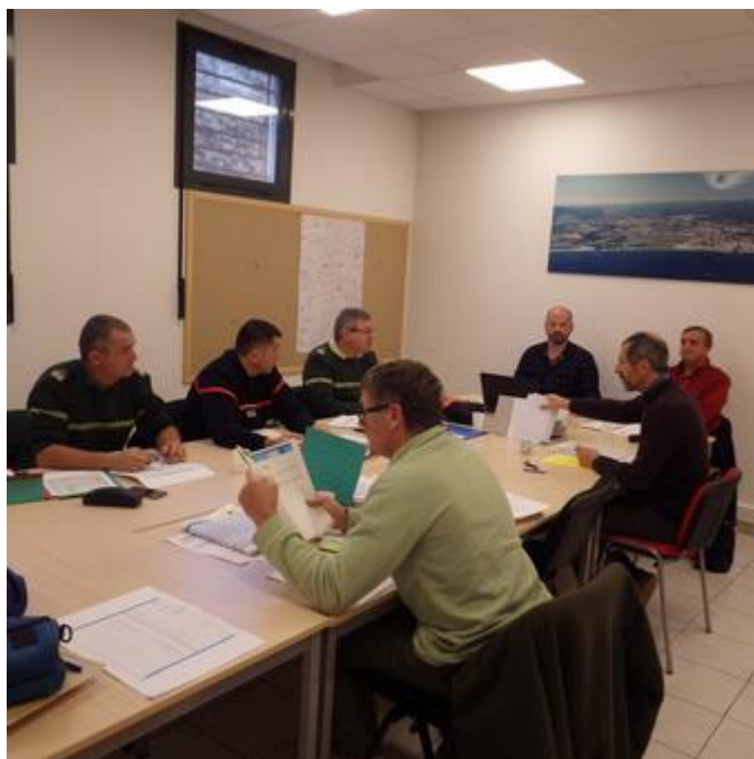
Réunion avec les partenaires institutionnels et techniques au siège du SIPME