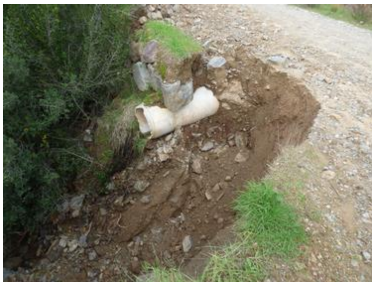
Piste DFCI G 31 de Malpasset

Dès le 25 novembre 2019, nous avons réalisé le recensement de tous les ouvrages. Quelques ouvrages ont été endommagés. Ils feront l'objet de réparations rapides en direct, soit par les soins de l'ONF en Forêt Domaniale de l'Estérel, soit par le Pôle Génie Civil du Département du Var dès que possible.