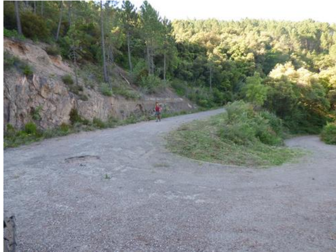
APFM : débroussaillage du glacis sur piste DFCI H 68 du Mont Vinaigre à Fréjus