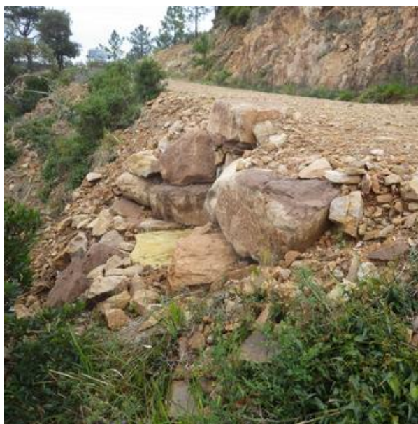
Piste DFCI H 33 du Rastel : création d'un passage busé de diamètre 600 en point bas de piste, réalisée par la commune de Saint Raphaël

La Municipalité a décidé de nommer de nouveaux responsables aux seins des Services Techniques. Souhaitant comprendre l'ensemble des relations qui lient les différents acteurs de la D.F.C.I., ceux-ci ont voulu créer une synergie entre le SIPME et leurs fonctions au sein de l'environnement et des forêts dont ils ont la responsabilité. En conséquence, les relations entre la Commune de Saint Raphaël et le SIPME s'en sont trouvées renforcées et améliorées au point de voir des réalisations financées par la Commune sur des pistes DFCI inscrites au PIDAF Estérel.