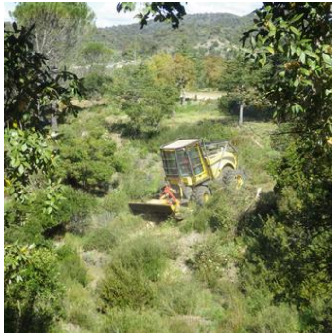
APFM : gyro broyage de la bande de sécurité sur piste DFCI H 78 de Boson à Fréjus