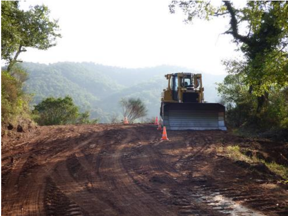
Buldozer sur la piste G 19 de la Culasse

2) Programme 2017 – Réalisation 2018 reportée à 2019 pour des raisons techniques.