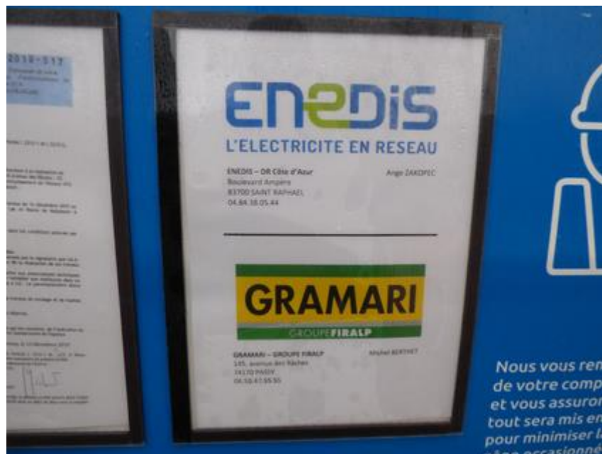
Affichage à l'entrée de la piste DFCI G 31 de Malpasset

En décembre de cette année, nous avons été informé du fait que les travaux de ENEDIS étaient susceptibles de commencer à partir de janvier 2020.