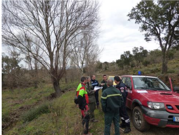
Visite technique de fin de chantier avec les partenaires institutionnels